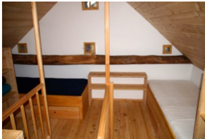
Schlafgalerie im Bewegungsraum