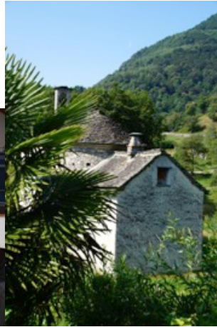
Oratorio Madonna di Montenero