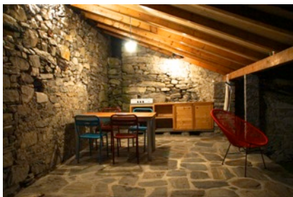
gedeckter Sitzplatz nachts