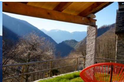
Terrasse Richtung Süden