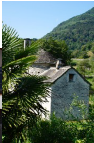
Oratorio Madonna di Montenero