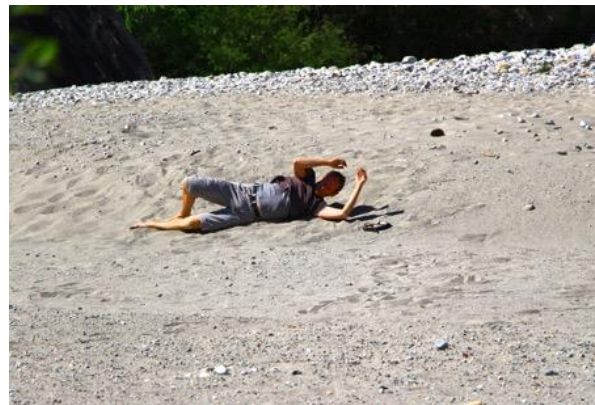
Arbeit in der Natur