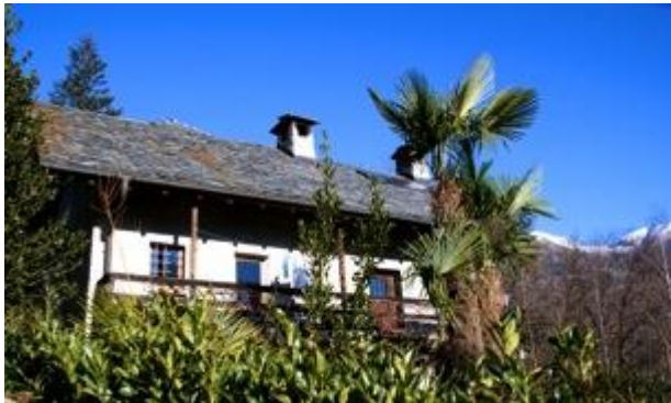
Casa Lucciola Südsicht

Die Casa Lucciola besteht aus einem Wohnhaus und einem ehemaligen Stall, der zu einem kleinen, stimmungsvollen Bewegungsraum umgebaut wurde. Das kleine Anwesen befindet sich auf einem sonnigen Plateau im unteren Maggiatal, umgeben von einer malerischen mediterranen Landschaft, die zur Arbeit in der Natur einlädt. Das Haus ist einfach aber komfortabel eingerichtet. Die KursteilnehmerInnen schlafen in einem 4-Bettzimmer, die Mahlzeiten werden gemeinsam gekocht.