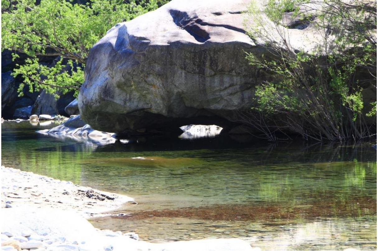
die Maggia bei Avegno, Foto Michel Casanovas