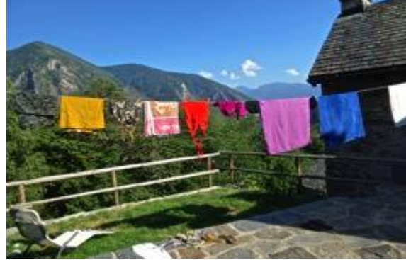
Sicht von der Terrasse