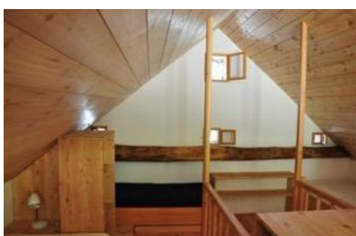
Schlafgalerie im Bewegungsraum