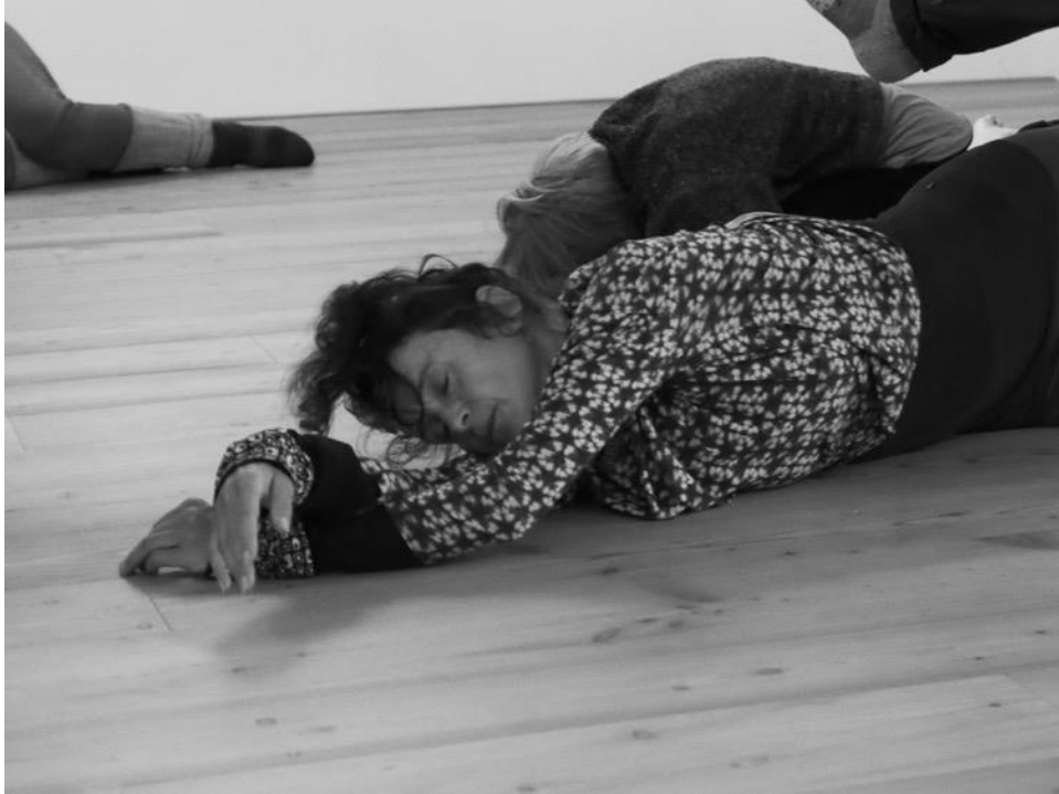
Workshop 2022