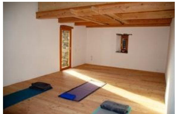
Arbeit im Bewegungsraum