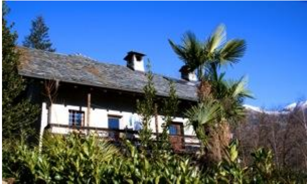
Casa Lucciola Südsicht

Anmeldung und Information p.collaud@bluewin.ch // http://www.patrickcollaud.ch/