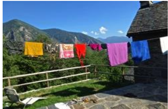
Sicht von der Terrasse