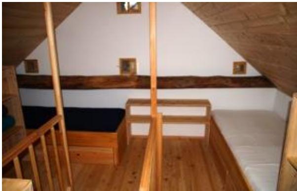
Schlafgalerie im Bewegungsraum