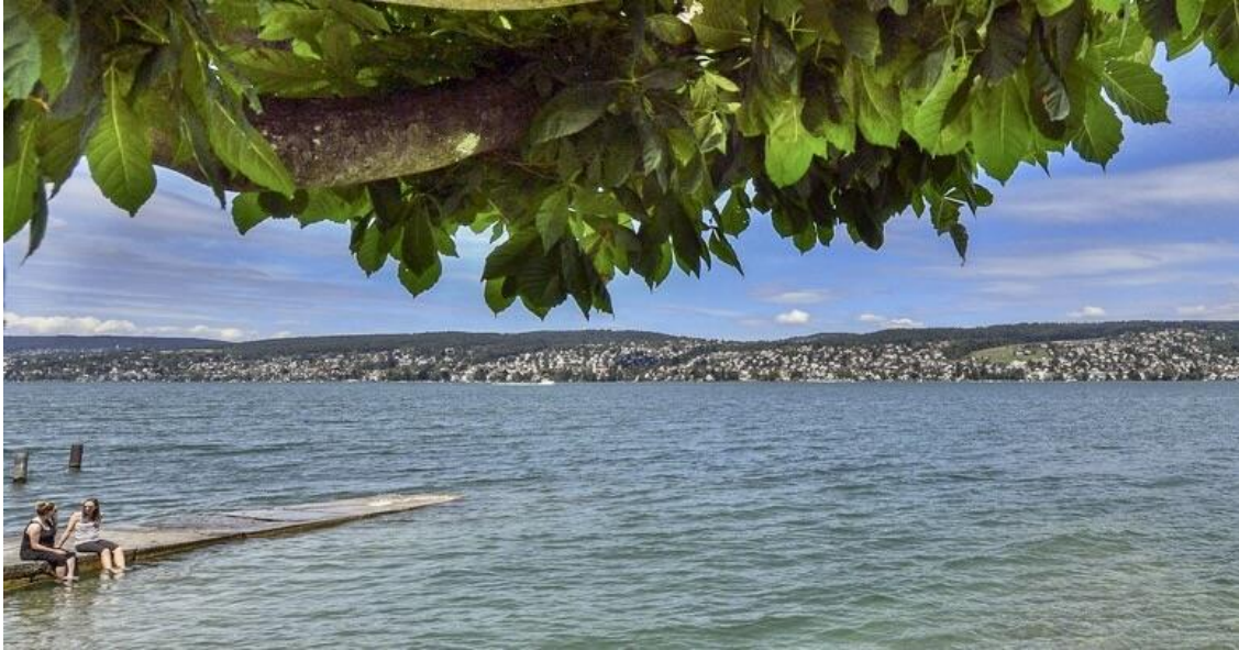
Der See bei Thalwil

Seit 1972 besteht die Contactimprovisation, entwickelt in den USA von einer Gruppe von TänzerInnen und Tänzern rund um Steve Paxton. Es war ein wilder, ungebändigter Tanz, der viele Konventionen aufbrach. In den mehr als 50 Jahren seit ihrem Bestehen hat die CI ihren eigenständigen Charakter bewahrt, obwohl sie von Anbeginn offen war für vielfältige Einflüsse sowohl westlicher als auch östlicher somatischer Praktiken. Diese haben den Tanz enorm bereichert, ihm mehr Geschmeidigkeit und Tiefe gegeben haben. Umgekehrt birgt die Contactimprovisation durch ihre hohe Vitalität und ihre dialogische Herangehensweise ein beträchtliches Potenzial für die Körperarbeit, für pädagogisch-therapeutische Anwendungen.