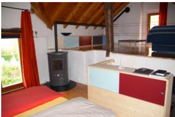
Schlafzimmer im Rustico