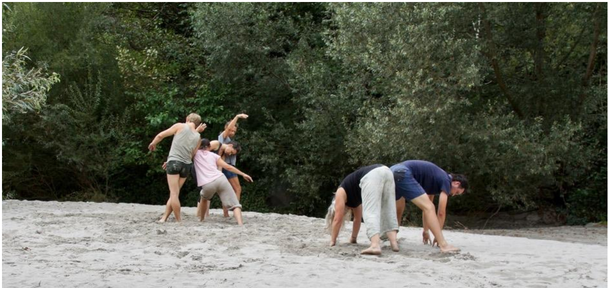
Gruppe Herbstkurs 2023