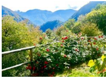
Terrasse Richtung Süden