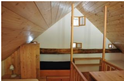
Schlafgalerie im Bewegungsraum