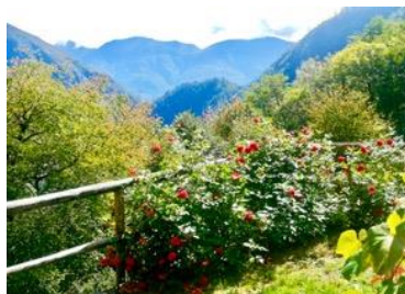
Terrasse Richtung Süden