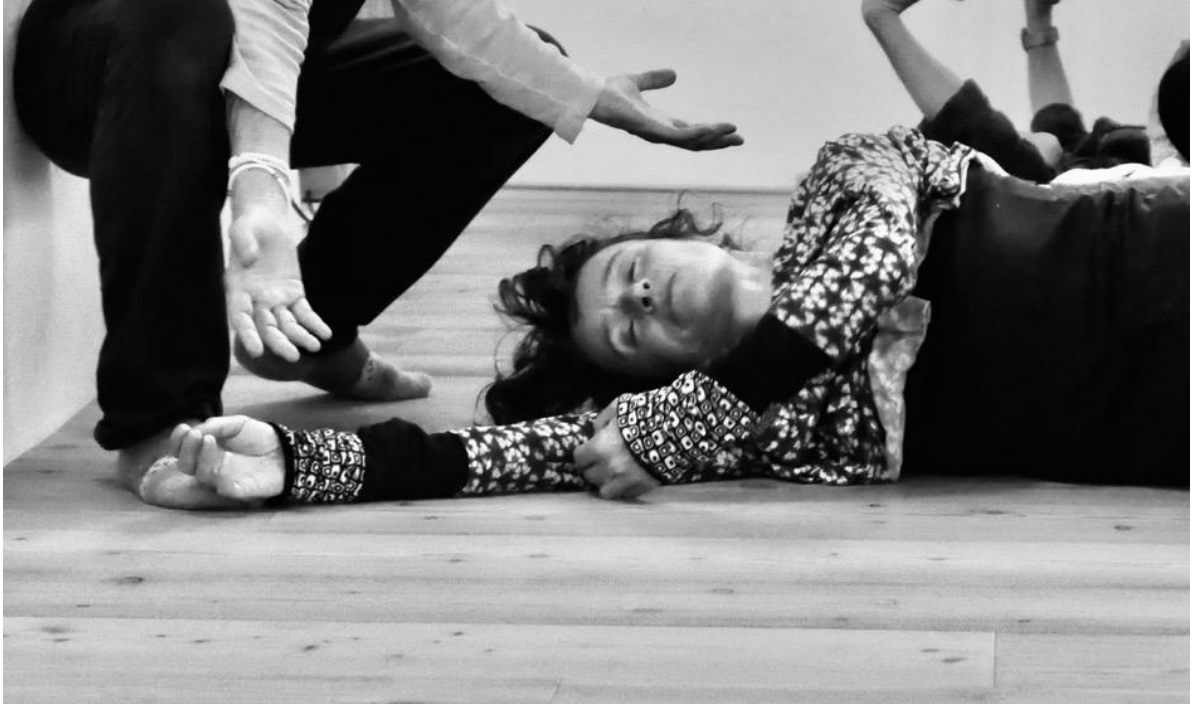
Bewegungsraum Casa Lucciola, Foto Michel Casanovas

Workshop mit Michel Casanovas im Vallemaggia, Casa Lucciola